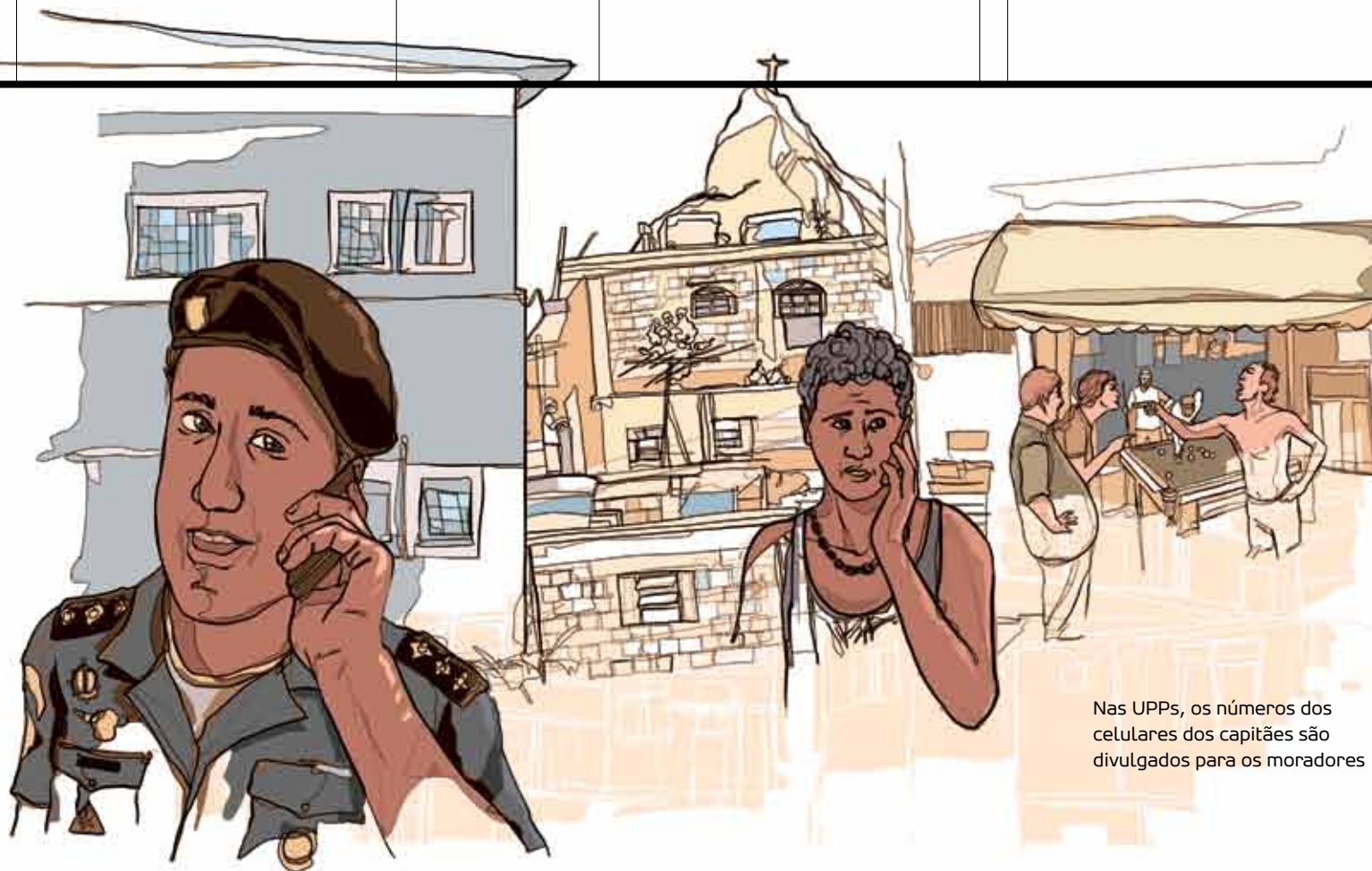
Nas UPPs, os números dos celulares dos capitães são divulgados para os moradores

Por outro lado, o acesso cada vez maior dos moradores a câmeras fotográficas digitais, celulares e a sites de relacionamento torna muito rápida a divulgação de algo que a polícia faça indevidamente. Há dois meses, na comunidade Cidade de