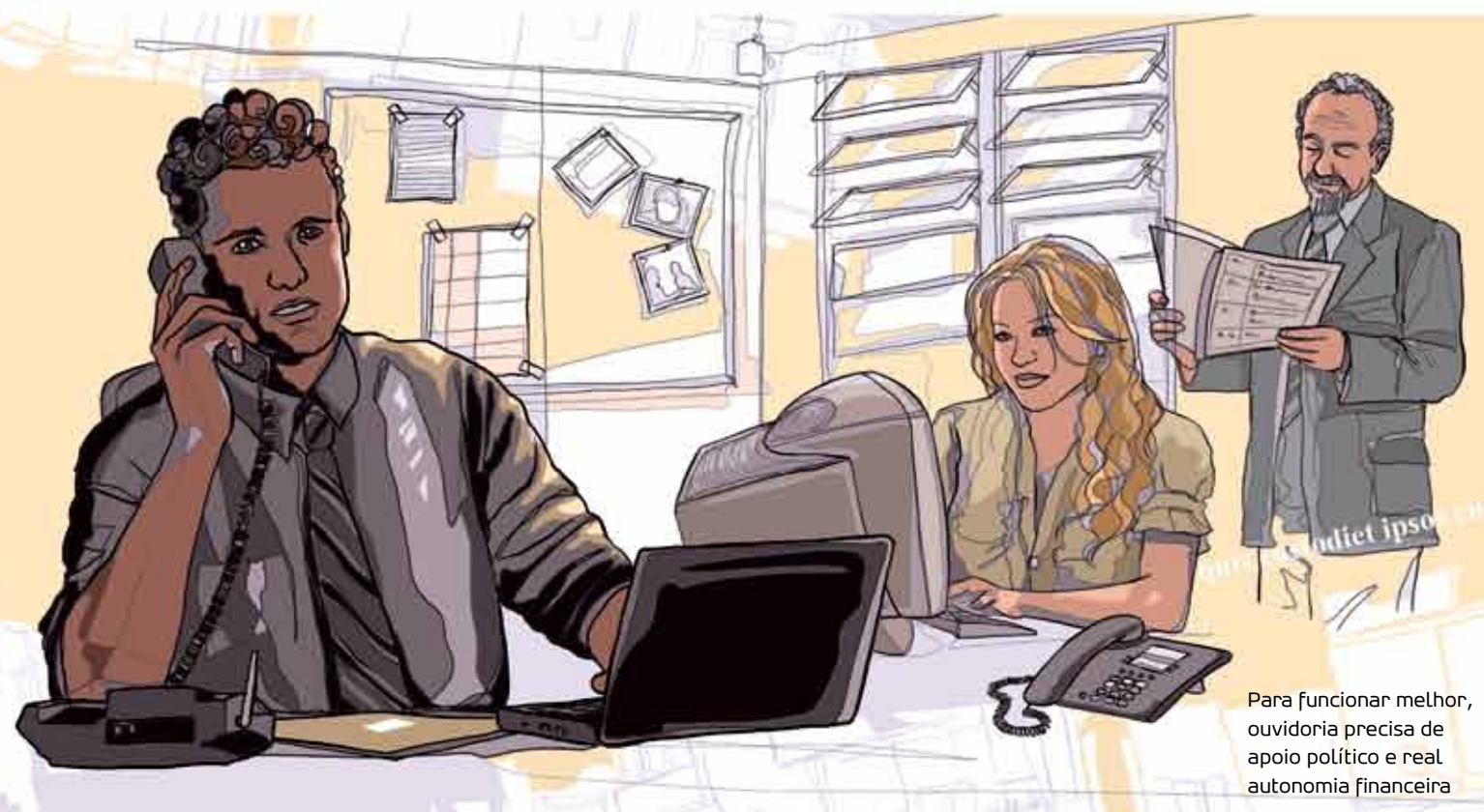
Para funcionar melhor, ouvidoria precisa de apoio político e real autonomia financeira

Ele defende a ação da Corregedoria e dos mecanismos internos. “As corregedorias fazem um controle forte. A cada ano cerca de 300 PMs são expulsos da corporação. Temos também a Justiça Militar, que é mais rigorosa do que a comum, e os conselhos disciplinares das unidades. Neles são abertos processos que independem do resultado da justiça comum. Às vezes o policial pode ser absolvido por falta de provas e mesmo assim é excluído.” Segundo ele, desde 2006 uma nova Lei facilitou o processo de desligamento de maus policiais, que agora podem ser excluídos em 90 dias.