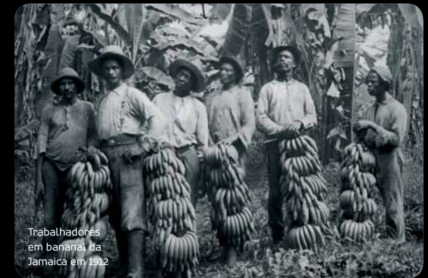
Trabalhadores em bananal da Jamaica em 1912