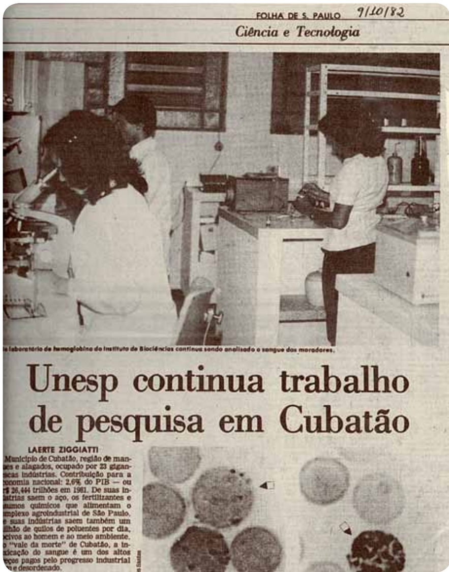
A imprensa acompanhou a investigação sobre os anencefálicos de Cubatão

cana, a doença aparece normalmente em descendentes de escravos, em geral pessoas pobres que vivem no meio rural ou em subúrbios.