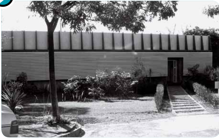
O Laboratório de Hemoglobinopatias que Naoum construiu e inaugurou em 1984