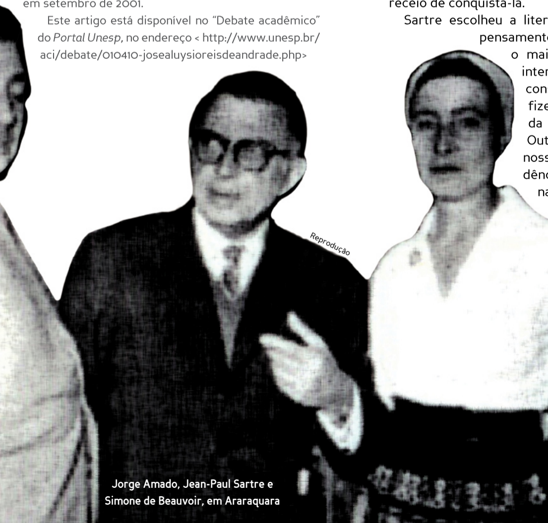
Jorge Amado, Jean-Paul Sartre e Simone de Beauvoir, em Araraquara

Sartre escolheu a ficção para difundir seu pensamento e atingir maior número de interlocutores