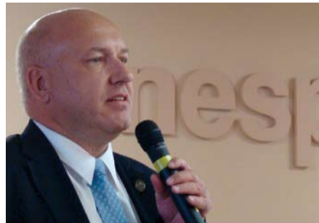
Hartung sugere novo paradigma para testes

Jornal Unesp: Quais os principais problemas envolvendo os experimentos com cobaias?