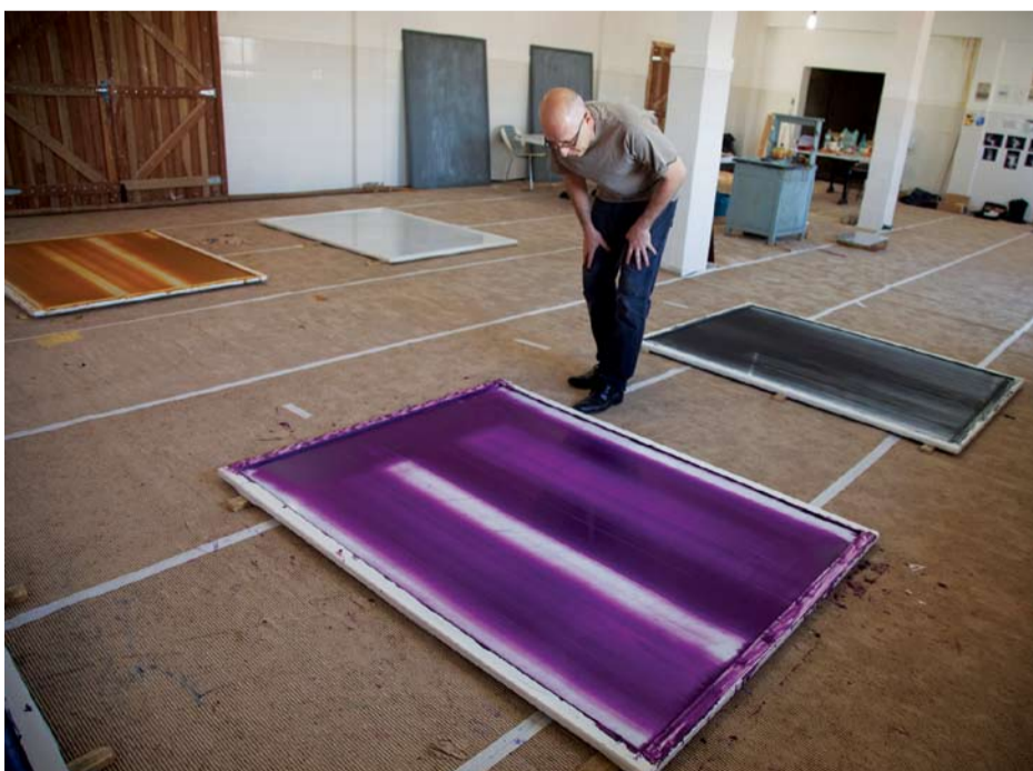
Artista plástico observa efeitos de opacidade e brilho em trabalhos em seu atêlie

Serviço: Fundação Bienal Parque Ibirapuera • Portão 3 • Pavilhão Ciccillo Matarazzo. Até 12 de dezembro. Horários de funcionamento: de 2ª a 4ª feira, das 9 às 19h; 5ª e 6ª feira, das 9 às 22h. Sábado e domingo: das 9 às 19h. Entrada gratuita e admitida até uma hora antes do fechamento.